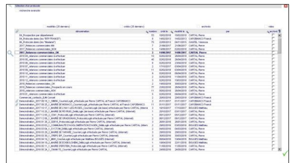
Liste des protocoles

Création de groupes d'interlocuteurs Nombre de protocoles illimité Regroupement de protocoles Alerte sur les doublons Extraction des informations pour diffusion multiple